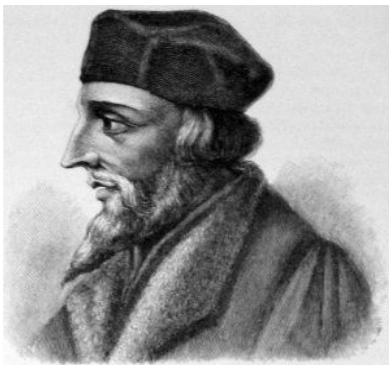
Jan Hus (1370-1415)

Siiski oli tema ideedele rohkem vastuseisjaid kui pooldajaid. 4. juulil 1415 kuulutas Konstanzi kirikukogu Jan Husi ketseriks ja ta hukati tuleriidal. Tšehhi kirikuajaloole tuginedes oli vaatamata kõigele siiski tegemist mehega, kelle jõulised väljaütlemised tekitasid kirikutes elava diskussiooni ja võimaldasid seega enam luua seoseid Pühakirja tekstide ja igapäevaelu vahel.