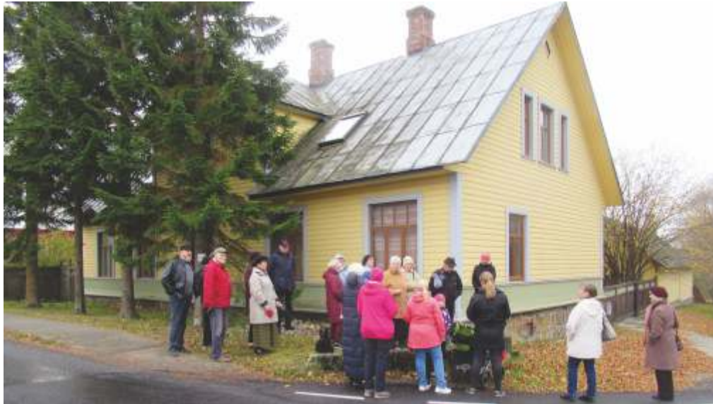
Neeruti seltsi ajalooaadress Kadrina Viru tänaval.

Tellitud retkedel nii loodusradadel Neeruti maastikukaitsealal kui ka Kadrina alevikus oli osalejaid 295.