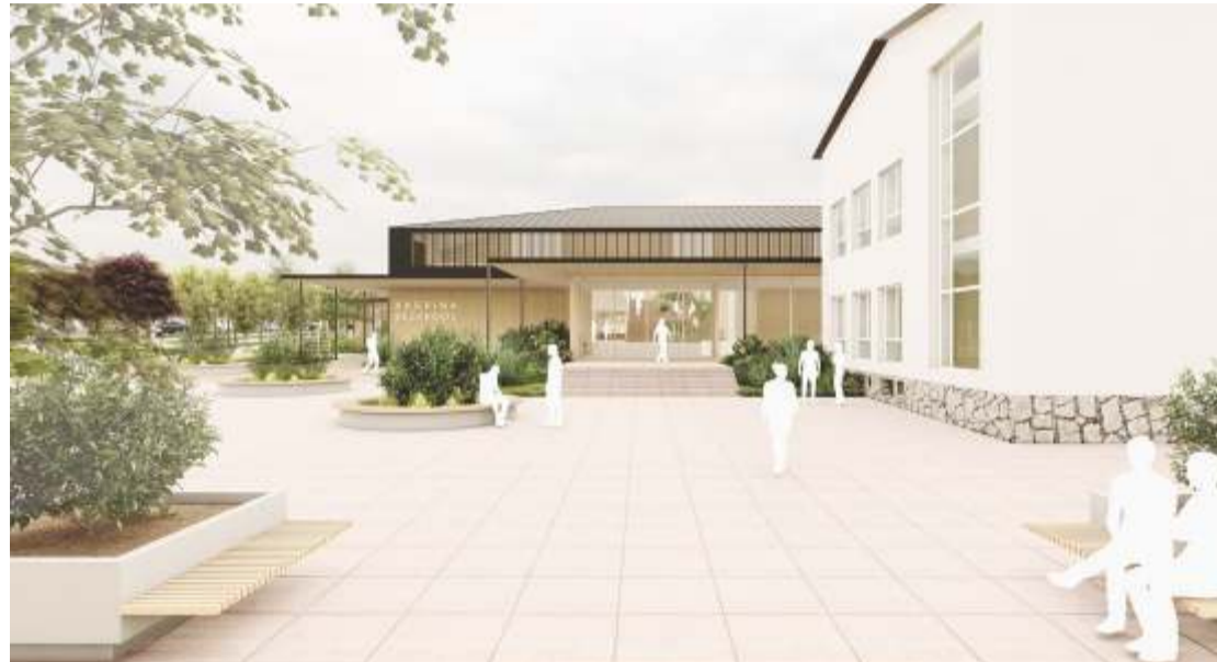
Vaade uuele koolimajale, paremal säiliv vana hoone. Pikemalt lk 2. Joonis: Arhitekt Must OÜ

Usume, et koolitee Kadrina kogukonna koolis hoiab meie lapsi hingelt tervena. Annab teadmised ja sotsiaalse küpsuse, et olla suurepärase