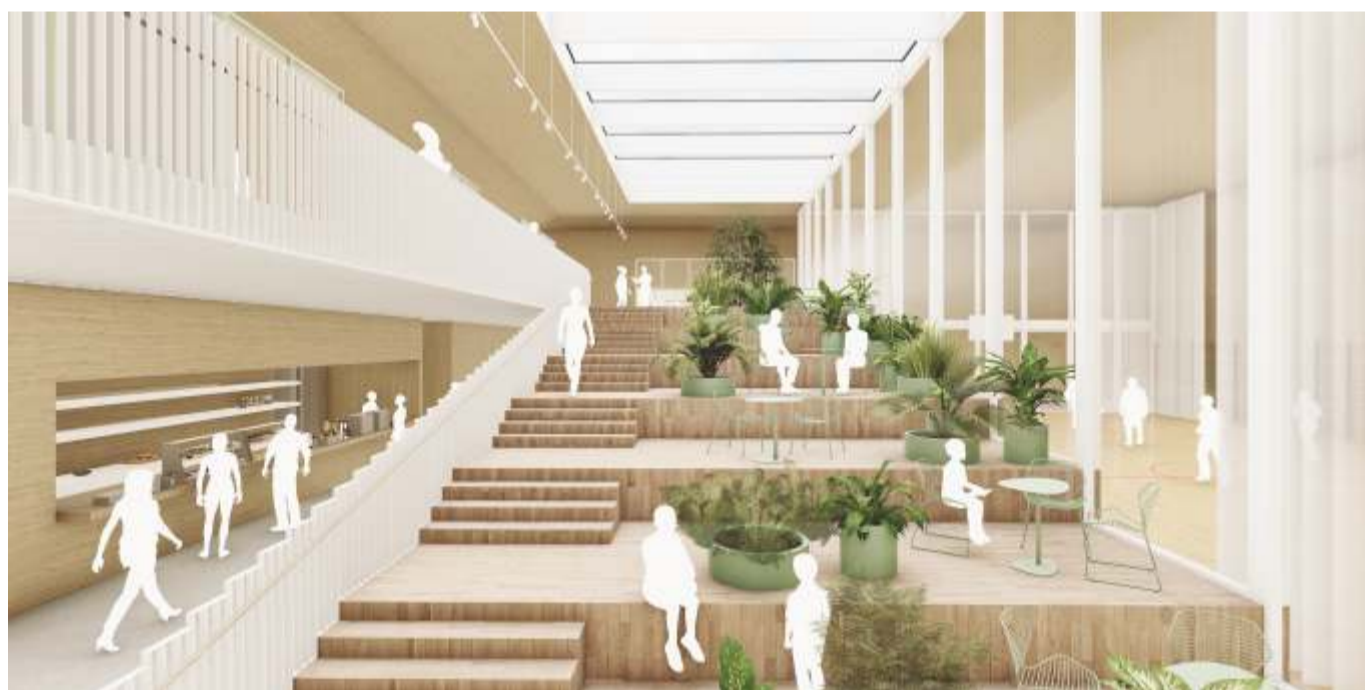
Keskse astmestiku ja istumisalaga ning läbi korruste seotud avalik ruum uues koolis. Joonis Arhitekt Must OÜ

Õpetamine ja õppimine on meeskonnatöö. Olen kindel, et uus koolimaja aitab oluliselt kaasa meeskonnatöö edendamisele ja parendamisele.