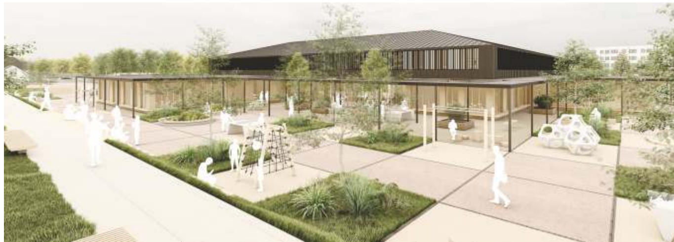
Vaade uuele koolimajale ja õuele huvikeskuse poolt. Joonis Arhitekt Must OÜ

Kadrina Keskkooli renoveerimisprojekt on eriline. Lähteülesande koostamiseks koguti visioone õpilastelt, õpetajatelt, lapsevanematelt. Hiljem tegeles kogutu analüüsi ja ruumi-programmi kokkupanekuga Kadrina hariduskogu. Toimunu teeb Kadrina kaasamise kogemuse eriliseks teiste samalaadsete konkursside hulgas.