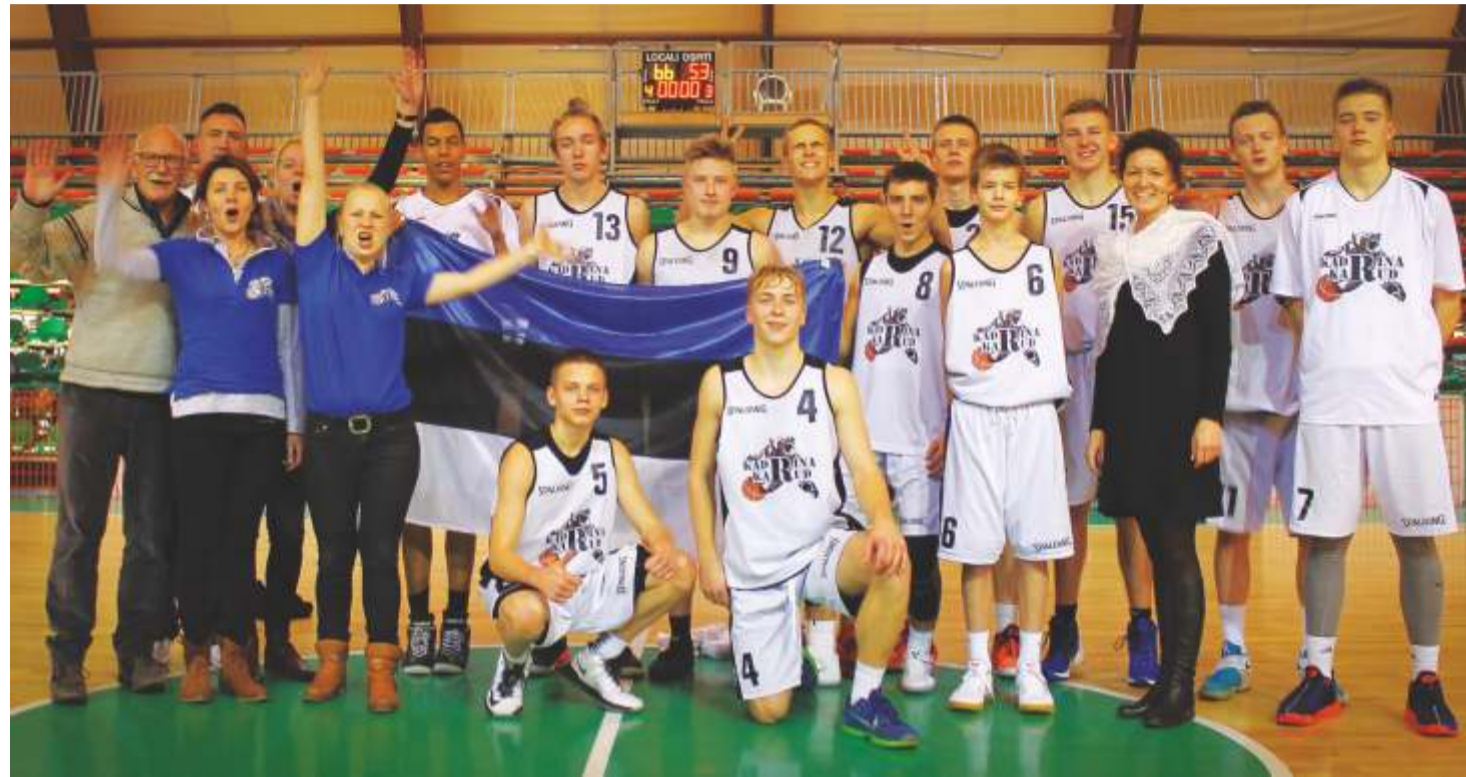
Hetk peale Rooma alistamist, Karud ja fännid. Seda ajaloolist fotot on nüüdseks Facebooki keskkonnas vaadatud ligi 6500 korda.

Vähe on Kadrinaga seotud inimesi, kes võiks väita: „Me purustasime Rooma.“ Kaksteist Kadrina Karude korvpallivõistkonna liiget tegidki seda 3. jaanuaril, osaledes Itaalias, Palestrinas kadrinlaste esimesel välisturniiril, kust naasesid kilbiga – kolmanda kohaga.