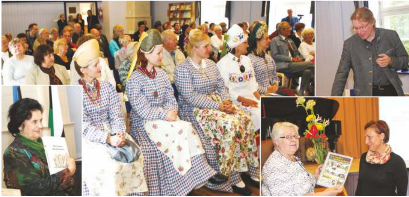
Fotomeenus Neeruti Seltsi sünnipäevakonverentsist

MTÜ Neeruti Selts tähistas 2016. aasta 17. septembril oma 15. sünnipäeva. Pidulikkust lisas Kadrina rahvamajas aset leidnud ühiskonverents Viru Instituudiga, kelle kaasabil sai saalitäis kohaletulnuid – nii seltsi liikmeid kui ka sõpru – kuulata kahte suurepärasest ettekannet.