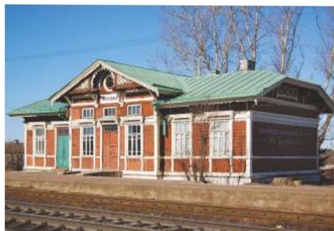
Fotol on Voiskovitsõ jaamahoone Venemaal 2007. aastal, lammutati 2012. Ehitati tõenäoliselt 1895. aasta paiku tüüpprojekti järgi, samal ajal kui valmis Kadrina teine, täna nähtav jaamahoone.

„Vabaõhumuuseum ei saa piirduda üksnes Kadrina jaamahoone eksponeerimisega, me peame looma juurde sinna konteksti kuulunud taristu, nagu see oli iseloomulik endistele raudteejaamadale. Et Kadrinast pole muid originaalhooneid saada, siis on kokkulepped mujalt raudteearsetest piirkondadest, et üle tuua ka endine töolistemaja, pagasimaja ja peldik, samuti tulevad raudteele paar eksponeeritavat vagunit ja dresiina. Nii ei hakka ekspositsioon sarnanema täpselt Kadrina raudteejaamaga, vaid tegemist saab olema üldistusega Eesti kunagistest väikestest raudteejaamadest,“ selgitas Lang. Kogu atraktsioon peab olema valmis 2023. aasta suvel.