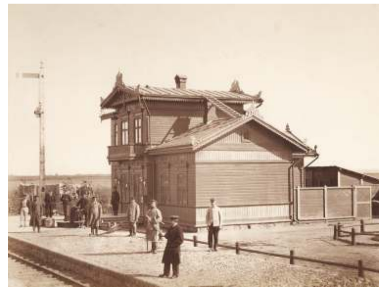
Unikaalne Tallinna fotograafi Charles Borchardt'i jäädvustus aastast 1870, mil Kadrina jaamahoone nägi välja just selline. Repro Tallinna Linnamuuseumi kogust.

Kadrina jaamahoone torkab silma eriti rikkaliku puitpitsi ja dekooriga. Hoones on säilinud hulgaliselt algseid detaile – karniislaed, kivi parkettpõrand, kassaluuk, laerostid. Külas-