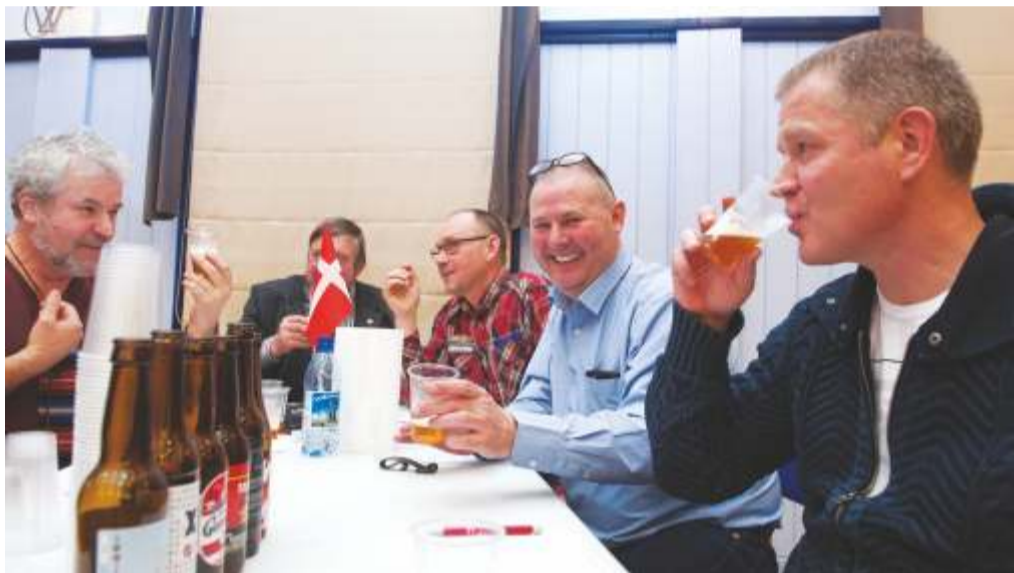
Õlu teeb õnnelikuks nähtub pildilt, kus degusteerimas ka Taani Kuningriigi esindus

Kuuekümmend testija hulgas oli esindatud viis riiki – Eesti, Soome, Taani, Moldova ja Ukraina. Teistpidi vaadates ka diplomaatiline korpus Soome praeguse ja Moldova endise suursaadiku näol ja vabariigi valitsus keskkonnaministrina. Kohal oli vallavanemaid, volikogude esimehi, Soome-Eesti õlleühenduse Olutsilda – Õlle-