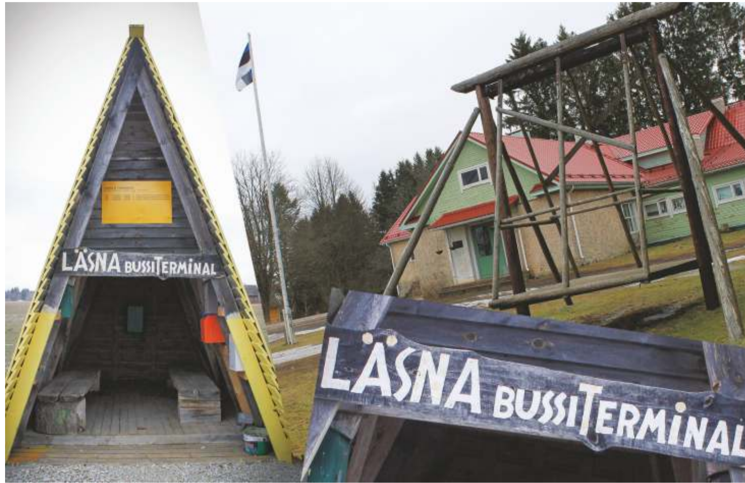
Läsna-Loobu kandi sümboleist tegi fotomontaaži Avo Seidelberg