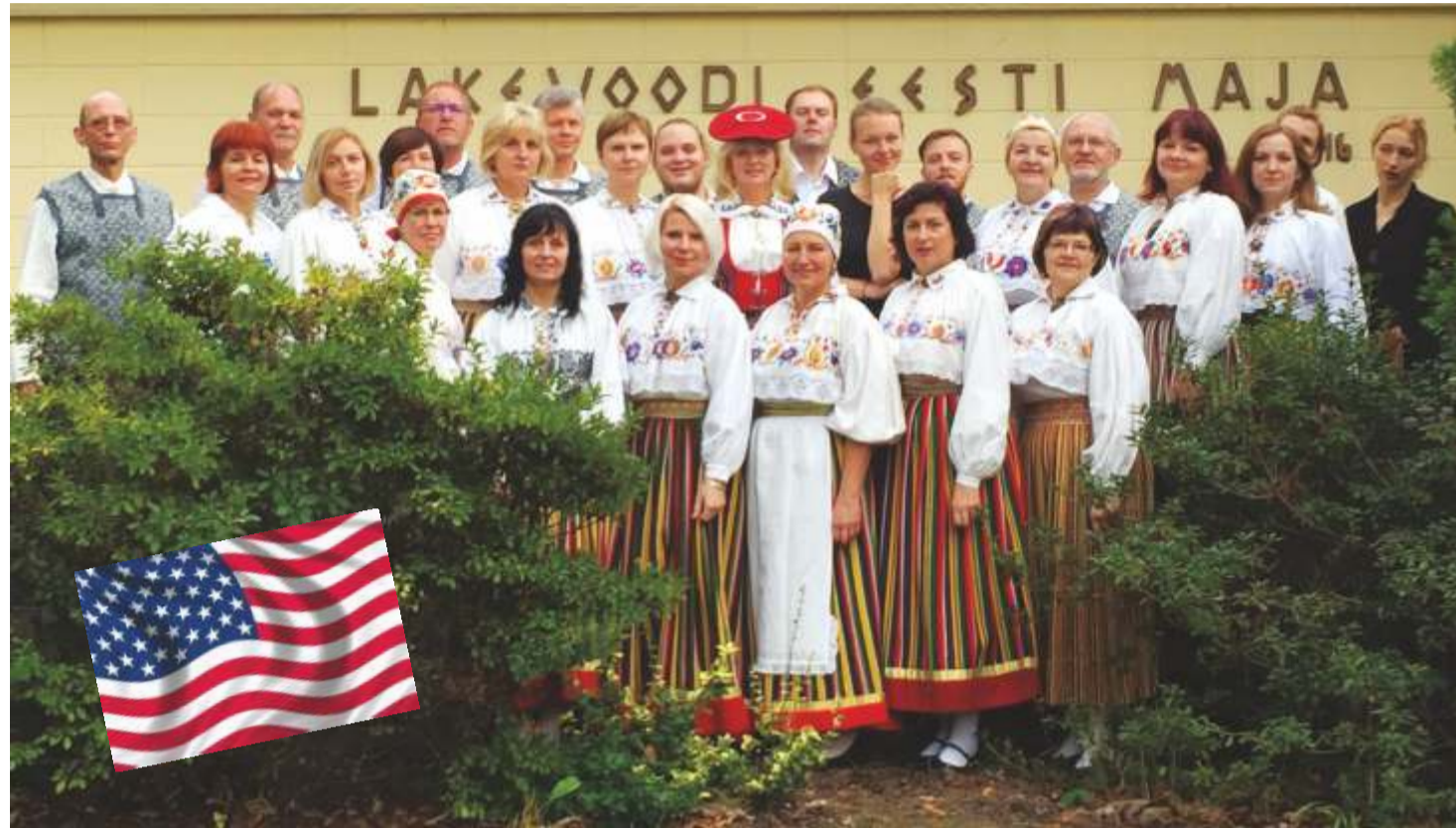
Kadrina segakoor pildistas, kuidas Kadrina segakoor Lakewoodi Eesti maja ees poseeris

Eestis on vähe taidluskollektiive, kes võivad väita: „New Yorgis aplodeeriti meile püsti seistes ja pisarsilmil.“ Aga just sellised – südamikud ja ülevoolavad - olid USA turneelt tagasi pöördunud Kadrina segakoori muljed.