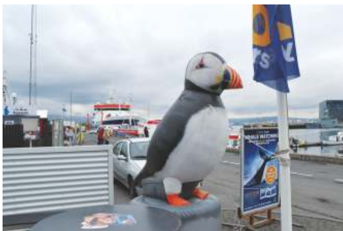
Põhjamaa papagooid lunnid võib hea õnne korral näha nii looduses kui ka tänavanurkadel turistide meelitamas.

Kõige olulisemaks ülesandeks seadsime koolide jätkusuutlikkuse, et konkurents püsima jääda. Kadrinas tähendas see sidemete tugevdamist valla ja ettevõtete, näidates õpilastele, et oma kodu ümbruses on võimalik meelepärast tööd leida, loodussõbralikus keskkonnas kodu rajada. Koolikeskkonda hinnates andsime üksteisele ideerohkelt nõu, kuidas olukorda veelgi parandada. Näiteks sai Kadrina kool hiljuti HAKA Plastik valmistatud uhked prügi-kastid ja kuulutustetuldad. Kohtumistel oli rõhk üks-