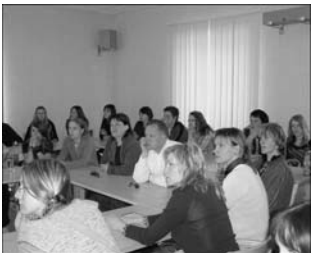
Sõpruskoolide õpilased ja õpetajad vaatavad huviga videofilm Kadrina vallast

Järgmisel aastal on sõprusfestivali korraldamise järg Josvainiai kooli käes.