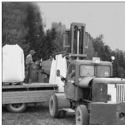
Lootusvälja talu on tuntud laialdase mehhaniseerituse poolest. Ka viljapõllu ääres töötav autotõstuk oli vajalik, et raskeid mehekõrgusi viljakotte autole tõsta.