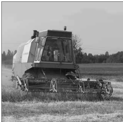
Vilja koristavat kombaini saatsid tänavu suured tolmutpilded. Nõnda oli see ka Kadrina valla Reinu talu põllul

Viljakasvatavad saavad oma saagi, ehkki kesisevõitu, siiski koristatud. Hullel lugu on rohumaadega, mis põuaga tõmbusid päris pruuniks. Talvise loomasööda varumisel oli arvestatud ka teise niitega, kuid niita pole midagi. Aga igapäevane loomade ninasine? Seda otsitakse nüüd looduslikelt kõlvikutelt või teiste maaomanikega lepinguid sõlmides.