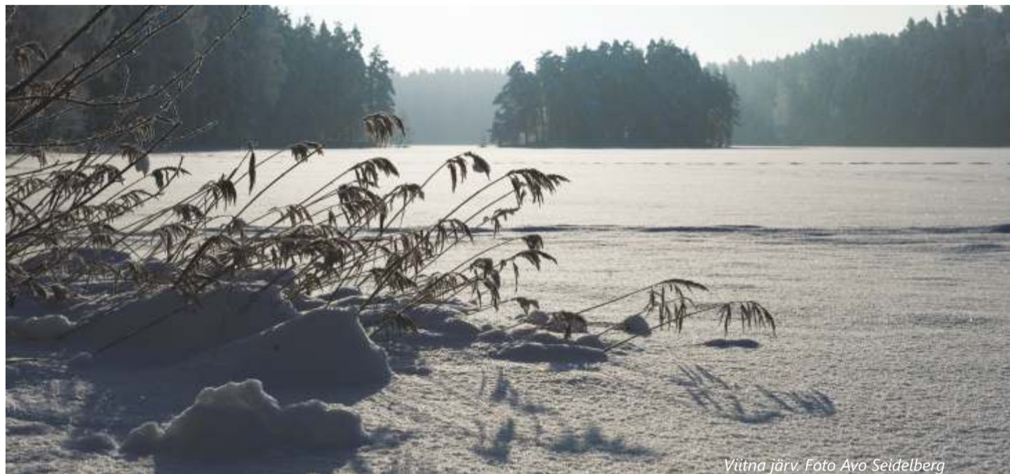
Viitna järv.