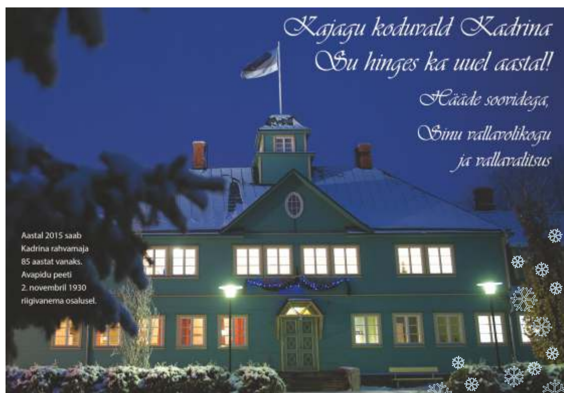
Aastal 2015 saab Kadrina rahvamaja 85 aastat vanaks. Avapidu peeti 2. novembril 1930 riigivanema osalusel.

Hääletuslehe võib saata või tuua Kadrina vallamajja aadressil Rakvere tee 14, Kadrina 45201