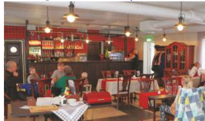
Tristvere kohvik pakub kõhutäidet ja ajaveedet.

meeskonnatöös. Kasuks tuleb eelnev töökogemus reklaami- ja turunduse alal, kunsti- või disainialane haridus, soome keele oskus suhtlustasemel. Lisainfo: Aasa 18, Kadrina alevik, tel +372 325 5910, info@pixner.ee , www.pixner.ee