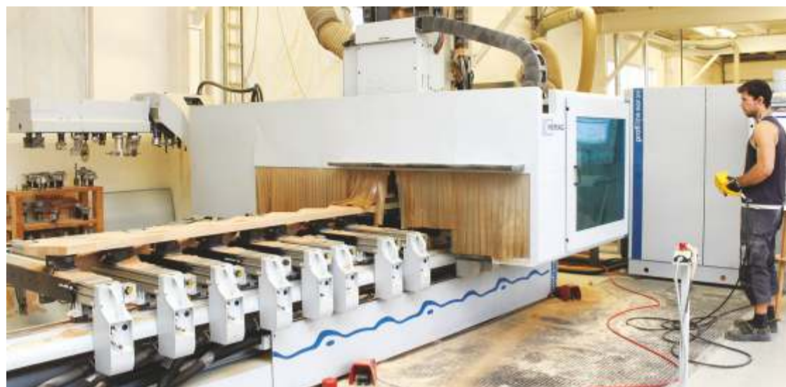
Aru Grupp valmistab puust uksi, aknaid, treppe ja maju.

Kontoripersonalist on vajadus ostuspetsialistide ja tootmise planeerijate järele. Lisainfo: Tööstuse 27, Kadrina alevik, tel +372 322 5720, flexa.eesti@flexa.ee , www.flexa.ee