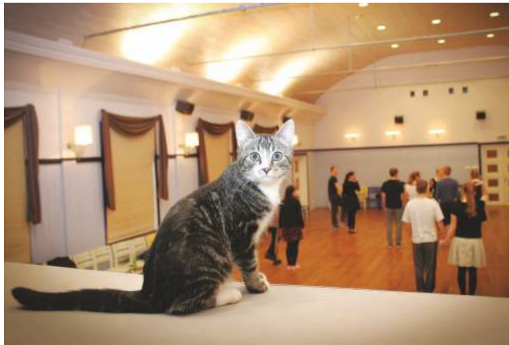
Kadrina rahvamaja saab tänavu 85 aastat vanaks.

Rahvamajadest tegutsevad Kadrina rahvamaja, Läsna rahvamaja, Ridaküla seltsimaja ja Kadrina kirjandusklubi Kadrina raamatukogus.