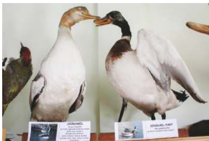
Neeruti seltsimajas asub kohalik loodusmuuseum.

Facebookis: Kadrina Rahvamaja; Läsna rahvamaja; Ridaküla Seltsimaja; Kadrina kirik; Kadrina Saunaklubi - KSK - Kadrina Sauna Club