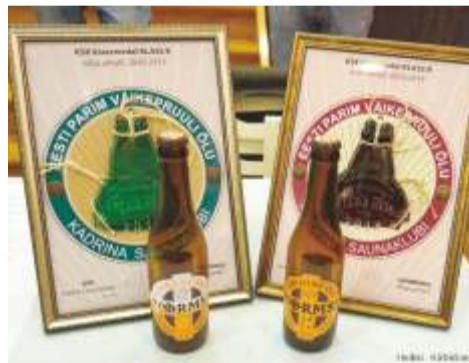
Fotol olevad võiduõlled on Kadrinas saadaval Tristvere kohvikus.

Lisaks 37 õllehindajale Eestist, Soomest, Taanist ja Moldovast andsid ettevõtmise kordamiseks oma panuse Kadrina kapell ja puhkpilliorkester, esitades spetsiaalselt kohalikuks õlleolümpiaiks valminud kava rahvalikest meloodiatest, mis soodustasid testimist.