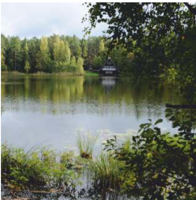
Viitna järv koos oma legendaarse motelliga.

Turismivaldkonnas tegutsevad Kadrina valla ettevõtjad alates ratsataludest kuni mahetoidu turismitaludeni. Pakutakse kõikvõimalikku alates aktiivse puhkuse matkadest-laagritest kuni õpetliku meisterdamise või taluelu ja -loomadega tutvumiseni. Osa turismiettevõtteid on koondunud võrgustikku Ehedad Elamused Lahemaal.