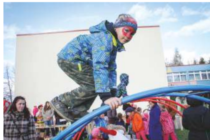
Fotomälestus Kadrina lasteaia perepäevalt.

Kadrina Keskkoolis on kesk- kooliastmes kolm õppe- suunda - humanitaar-sotsiaalsuund (HUSO), loodusteaduste suund (LOTE) ja reaaltehniline suund (RETE). Reaaltehnilise suuna eriala edukas lõpetaja saab Tallinna Tehnikaülikooli sisseastumisel ühe täiendava konkursipunkti.