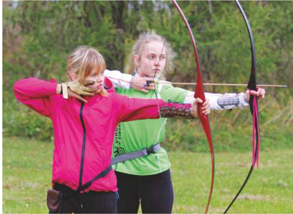
Vohnja vibulaskurid on jõudnud isegi maailmameistriõistlustele.

Kadrina ujula ja spordihoone on avatud igapäevaselt. Seal asuvad ka jõu- ja maadlus-saalid ja lasketiir. Spordiklubi Kadrina treeningutest on esindatud jalg-, võrk- ja korvpall, ujumine, maadlus, lauatenis ja kergetõustik. Kadrina Keskkooli ruumides toimuvad erinevad aeroobikatreeningud ning spordihoones ka vesi-aeroobika. Väritingimustes on tervisespordiharrastajatele kergliiklustee Kadrina alevikust Hulja alevikuni ning kergliiklustee ümber Kadrina paisjärve.