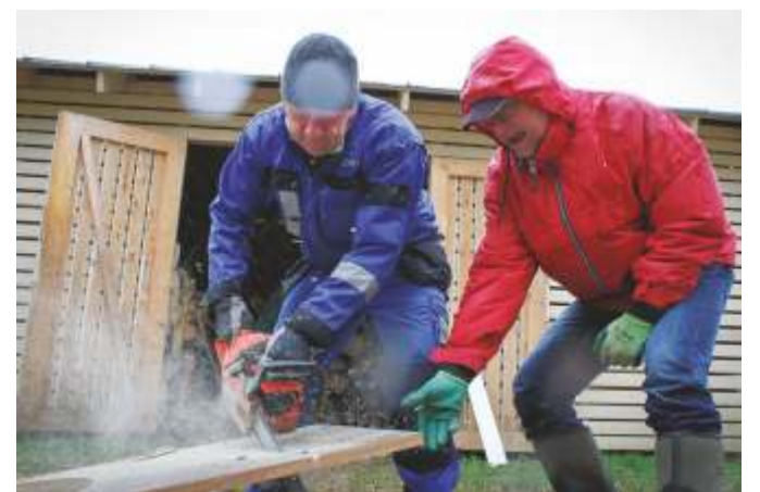
Kadrina saunatalgud on iga-aastane heakorra-aktioon.