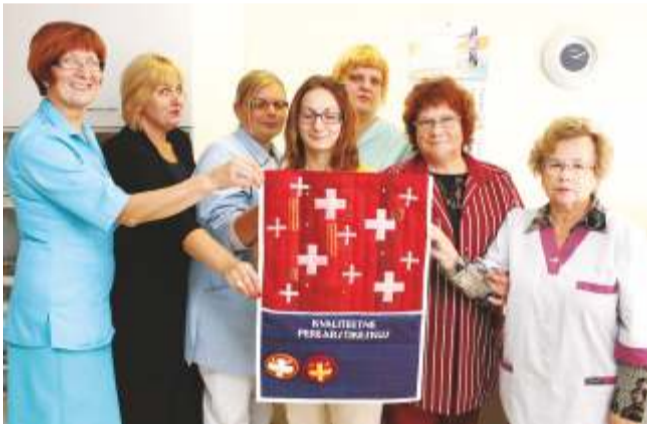
Nemad toovad tervise ehk osa perearstikeskuse perest.

Kadrinas tegutseb kolme perearstiga tervisekeskus, mis on teist aastat järjest Eesti neljakümne parima perearstipraksise hulgas. Kadrinas on ka kohalik apteek.