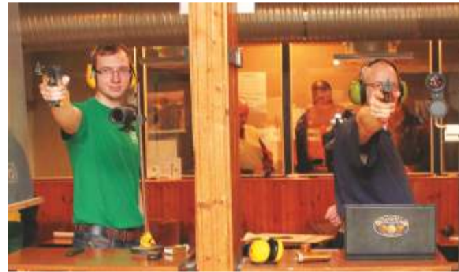
Kadrina lasketiiru hindavad ka kaitseliitlased ja politseinikud.

Lisainfo: www.kadrina.ee , facebookis Kadrina Sport