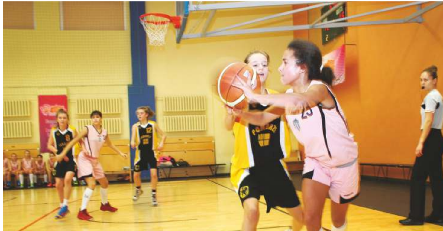
Kadrina sportimisvõimalused hinnati kuueks hea elu kriteeriumiks. Fotol hetk rahvusvaheliselt neidude korvpalliturniirilt.

Et kõik algusest peale ja ausalt ära seletada, tuleb alustada sellest, et Kadrina vald otsustas esmakordselt minna messile „Maale elama.“ Tegemist on 2012. aastal käima lükatud algatusega, mille raames tutvustavad aktiivsed külad ja vallad oma võimalusi võimalikele uutele elanikele. Messipaigaks on Kalevi spordihall Tallinnas ja messipäevaks laupäev, 11. aprill 2015. Kadrinast läheb kohale kümneliikmeline seltskond.