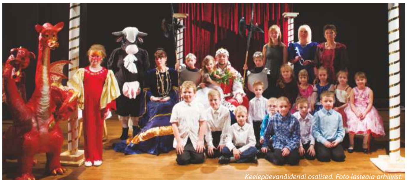
Keelepäevanäidendi osalised. Foto lasteaiarihiivist.

Neeruti Seltsi jalgrattaretk Kadrina – Mädaepa – Rakvere – Kadrina . Helkurvest selga, kiiver pähe, võileib taskusse!