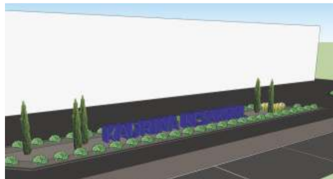
Vanade ja väsinud puude asemel tuleb kooli ette suur kolmemõõtmeline kiri.

Kooli eest lõigatakse maha suured puud, mille eluiga hakkab otsa saama. Nii saab kaunis fassaad rahvale paremini nähtavaks. Rattaparkla kolib kooli eest ära. Selle asemele tuleb koos haljastusega suur kolmemõõtmeline kiri - Kadrina Keskkool.