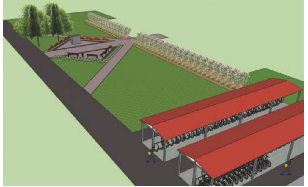
Keskkooli ja kunagise Krahvi Sahvri vahele rajatakse katusega jalgrattaparklad. Taamal emakeeleausammas.

Senini on Kadrinal puudunud konkreetne keskväljak. Selleks kujundatakse rahvamaja ja Risti poe vaheline ala, mida jäävad ääristama rahvamaja küljed, trepistik ja kuur. Kunagi väljaku keskele planeeritud pürskkaevu vist siiski ei rajata. Küll aga on tekkinud plaan kaunistada väljaku