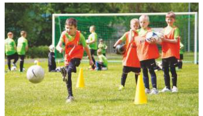
Ain Liiva fotol on Eesti vuti tulevik.

Kolm tüdrukut ja kolmkümmend kaks poissi vanuses 6-12 harjutasid Kadrinas nelja treeneri juhendamisel viis päeva jalgpalli mängimist. Tegemist oli siin esmakordselt toimunud