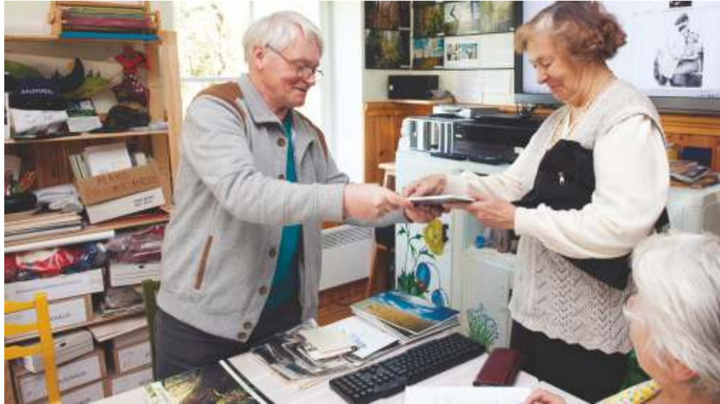
Hetk puuderaamatu esitluselt Neeruti seltsimajas.