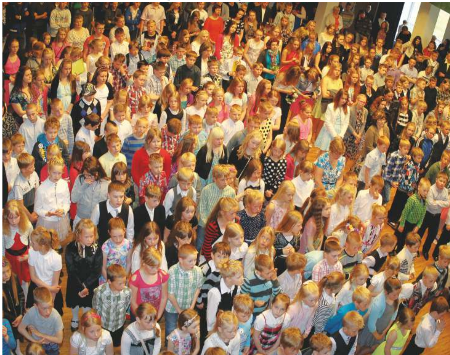
Kadrina Keskkooli pere õppeaasta lõpuaktusel.

Õppeaasta lõpeb. Kadrina Keskkooli lõpetab tänavu 55. lend. Loomulikult oleks sel taustal ülikena välja tuua absoluutselt kõigil olümpiaadidel ja konkurssidel edukalt osalenud Kadrina Keskkooli õppurite ja neid õpetanud pedagoogide nimed. See vajaks aga suisa erilehte. See pärast piirdugem vaid parimatest parimatega.