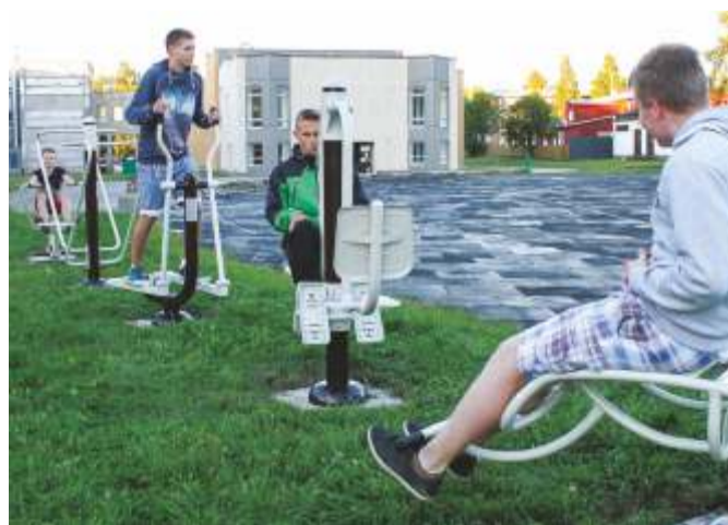
Kuus treenimismasinat saavad nüüd vatti.

Ühes palliplatsi inventari kōpitsemisega ilmusid samasse