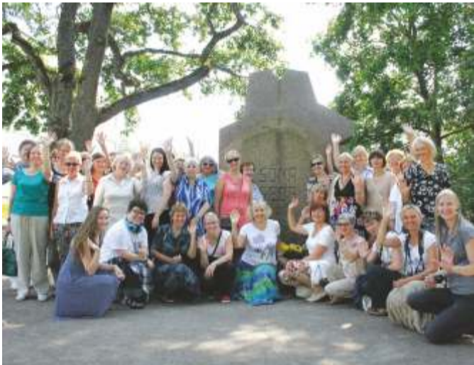
Emakeeleausammas, paslikeim pildipaik raamatukogurahvale.

6. augustil väisas Kadrinat bussitais Eestimaa rahvaraamatukogude suvelaagris osalejaid. Daamid said tuttavaks Kadrina valla raamatukogu ja kohaliku kirjandusklubi looga. Elevust tekitas aktiivsest filmielust teadasaamine. Oma silmaga vaadati üle Kadrina tähtsamad objektid. Arutelu ainet andsid ristisalu kavandid.