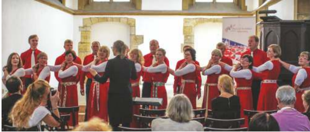
Kadrinlased Tormist laulmas ja tantsimas.

Teisel reisiõhtul premeerisime end kordaläinud esinemise eest paadisõiduga Vltava jõel. Elav muusika, maitsvad toidud ning hingematvalt kaunid vaated Praha vanalin-