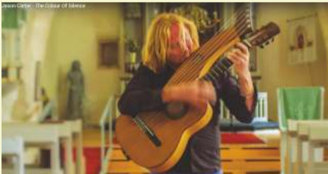
Fotol kaader videost.