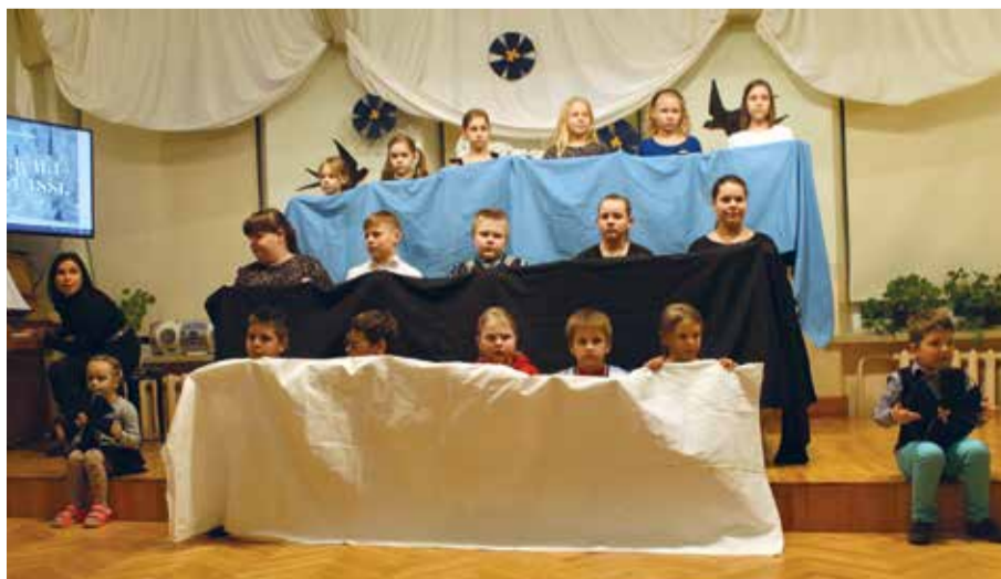
Austusavaldusest kodumaale said osa terve lasteaed-alkool ning saalitais külalisi. Laste valmistatud hõrgutisi kiitsid kõik!