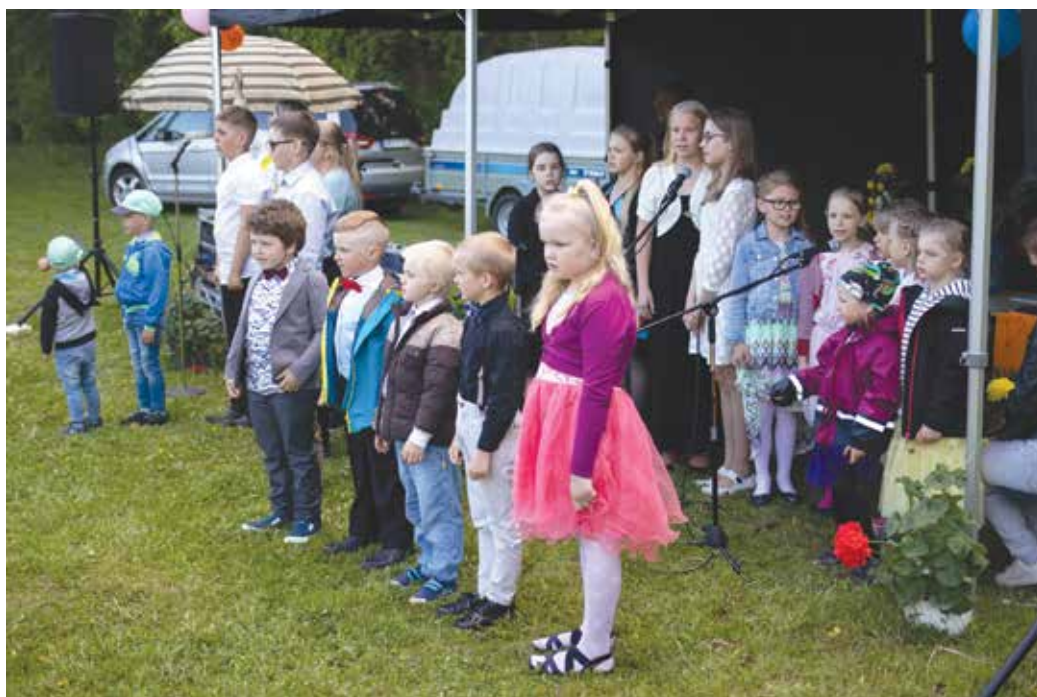
Kevadpidu oli kena ilmaga lausa lust õues pidada.