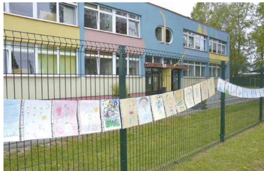
Laste joonistuste näitus lasteaia aial.