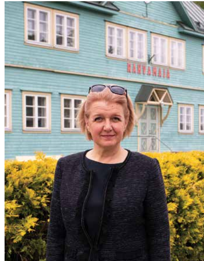
Vallavanem tehnilise uuenduskuuri saanud rahvamaja taustal.

Viru tänaval viibijad on kindlasti märganud, et tervisekeskuse ehitustööd on lõppenud. Parajasti käib seadmete ja süsteemide häälestamine, et need tomiksid laitmatult. Eriolukorra tõttu on viibinud trepi katteplaatide tarne ja seetõttu on mõned välistööd veel siiski pooleli. Juuni lõpuks peaks olema hoone vajaliku mööbliga sisustatud. Kõigi eelduste ko-