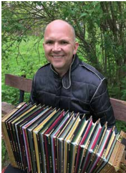
Kadrina rahvariideseeliku värvides lõõtspill.

Tema lõõtspilli teeb eriliseks aga see, et kangas vahelõõtsa jaoks on kenas Kadrina rahvariide triibustikus. „Mõtlesin, et äkki teeks punase või rohelise, aga siis jäi mulle silma Kadrina triibustik ning taipasin, et kuna ma Kadrinas olen ja Kadrinasse ka jään, siis miks mitte teha lõõts ilus triibuline,“ ütles Kübar ning lisas, et pill on sündinud armastusest Kadrina vastu. Esimese pilli suhtes on meister küll veidi kriitiline, kuid rohkem ikka rahul. „Õeldakse, et esimene läheb ikka aia taha, aga see esimene on ikkagi kõige kallim ja armsam,“ lisas ta. „Nüüd tuleb ainult ennast kätte võtta ja õppida seda pilli kenasti mängima, aga selleks see pill tehtud saigi,“ sõnas Kübar. (KK)