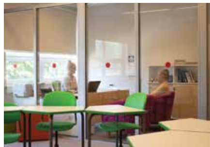
Spetsialistide kabinetid asuvad samuti klassiruumis, kuid on eraldatud klaasist seintega.

Projekti käigus kaasajastati tugispetsialistide tööruumid ning klassiruumid, kus töötatakse erivajadustega õpilastega. Tugispetsialistide tööruumid viidi üle C-korpuses olevasse tiiba, kus värskenud viimistlust ning ruumid sisustati tänapäevase mööbliga. Privaatsed ruumid pakuvad mitmekülgeid võimalusi nõustamiseks, tunnirahu tagamiseks või aja maha võtmiseks. Koridoridesse loodi puhkealad, kuhu on paigutatud kott-toolid, tumbad, mängulauad, et pakkuda mitmekülgeid võimalusi vahetundide