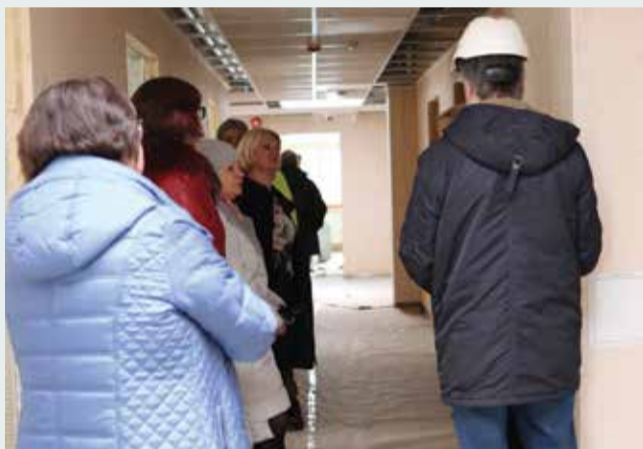
Perearstid ja personal uue majaga tutvumas.