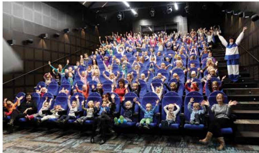
Sipsikupere õnnejoovastuses „Sipsiku“ filmi eel.

20. veebruaril oli Kadrina maja elevust ja ootusärevust täis. Toimus Eestimaal aastapäevale pühendatud kontsert-aktus koos lippude, hünni laulmise, kõnede kuulamise, luuletuste, laulude ja tantsudega - nii pidulik ja püha nagu üks Eesti Vabariigi aastapäev olema peab. Laste silmad särasid ja süda rõõmustas. Eestimaal sai 102, seda teab meil iga laps!