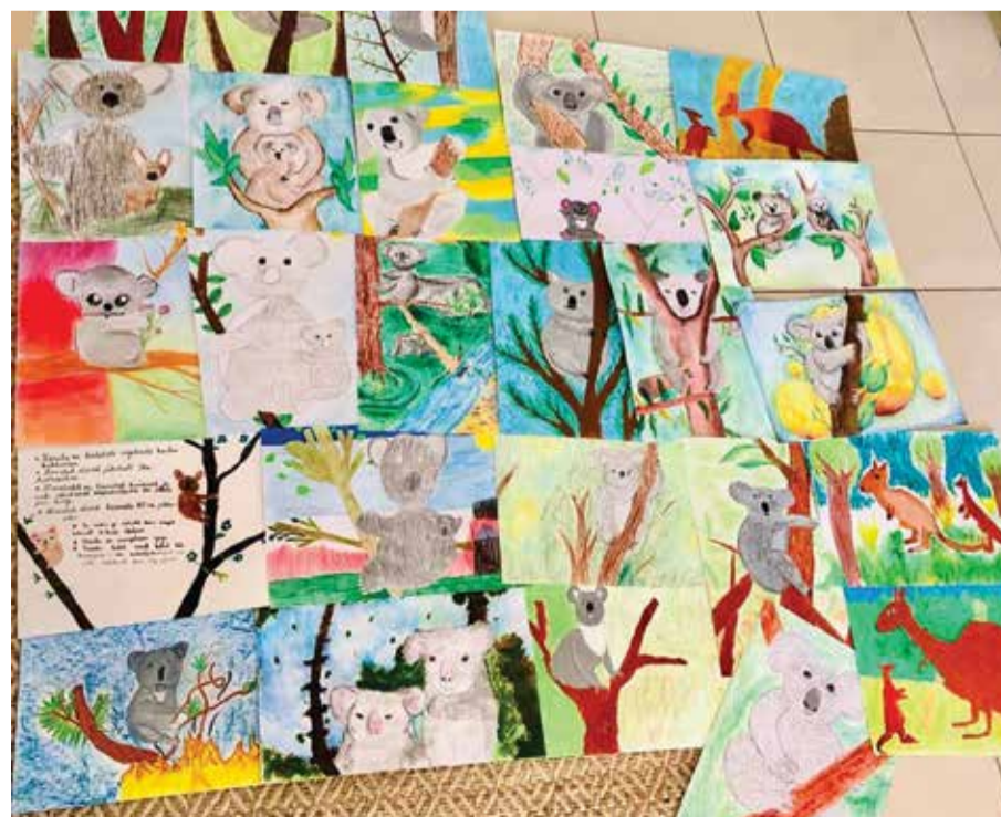
Eestlaste värvilised kunstiteosed, mis pakuvad rõõmu igale vabatahtlikule.