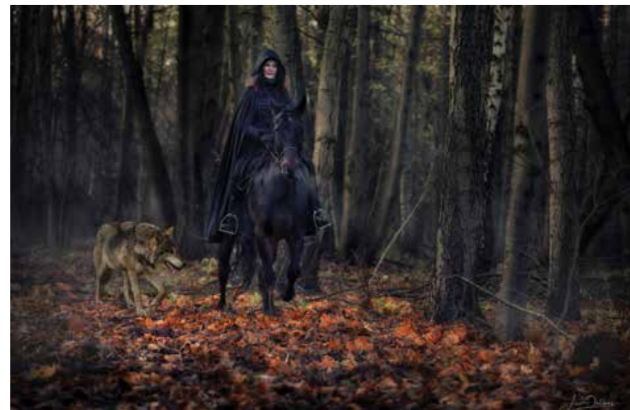
Müstiline maailm, mis on leitav kindlasti ka Läsna metsade vahelt.

„Loomaarstilood“ kirjutasin sisuliselt lugejate tellimuse peale, kui nad olid esimese raamatu läbi lugenud ja oma tagasiside andnud, et arstiteemat oli ikka liiga vähe, vaja rohkem. Üks hea kolleeg iseloomustas „Loomaarstilugusid“ väga tabavalt, et raamat on kontsentreeritud nagu puljongikuubik. See oligi eesmärk – tulemus pidi saama klaar ja kange. Ma ei armasta nämmutada, vaid