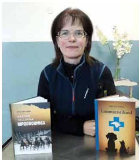
Kirjutajast loomaarst oma põnevust pakuvate kirjatükkidega.

Raamatu kirjutamiseni jõudsin pärast 30 aastat hipodroomil materjali kogumist. 2016. aasta sügisel. Võistlushooaja lõppedes tekkis moment, kui tegevus hipodroomil jäi olematuks, kaamos tuli peale. Pidevalt tiksus kuklas, millal tuleb kompsud kokku panna ning ei jäänudki muud üle, kui see ahastus paberile panna. Tekst ise ei saanudki väga ahastav, vaid suures osas naljakaski, nagu lugejad mainivad. Raamat on kirju-