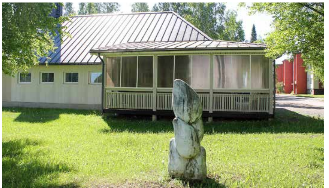
Ajahamba poolt näritud, 15-aastane skulptuur.