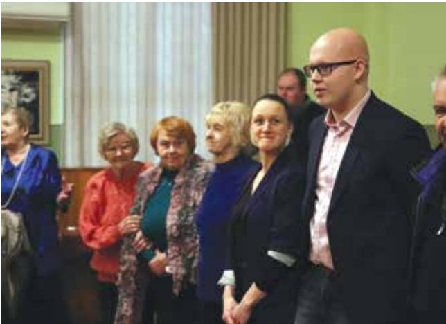
Paremal filmi autor Kristjan Pärnamäe koos filmis intervjuu andnutega.