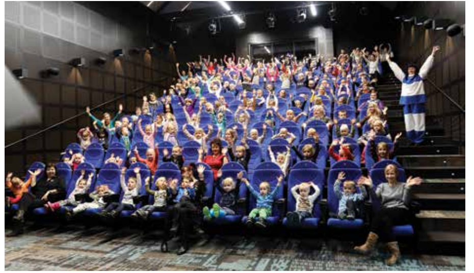
Sipsikupere õnnejoovastuses „Sipsiku“ filmi eel.