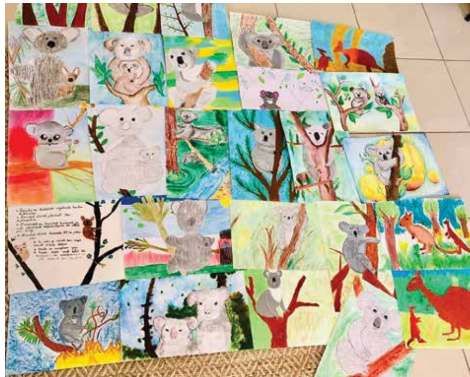
Eestlaste värvilised kunstiteosed, mis pakuvad rõõmu igale vabatahtlikule.