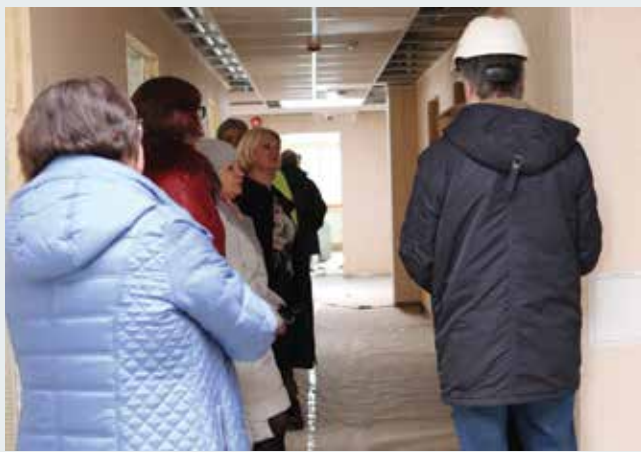
Perearstid ja personal uue majaga tutvumas.