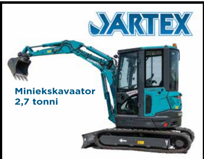
Miniekskavaator 2,7 tonni