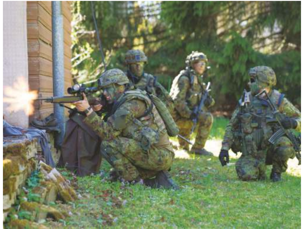
Sõdurid õppusel Kevadtorm.

üle Eesti tavapärasest rohkem kaitseväge ja liitlaste tehnikat, mistõttu tuleks Kevadtormi vältel olla liikluses veelgi tähelepanelikum ning jälgida muutuda võivad liikluskorraldust. Samuti kasutatakse õppuse ajal tavapärasest rohkem lennuvahendeid.