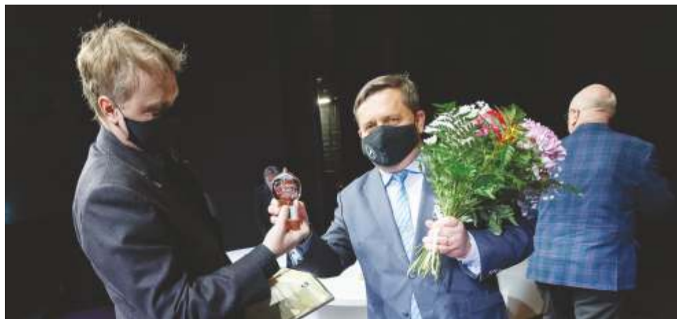
Kõige tervisesõbralikum organisatsioon on Kadrinas.