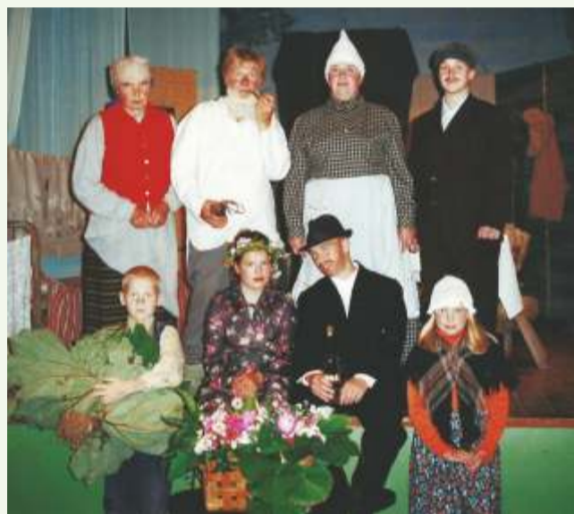
Foto Rihard Laisaare uurimistööst „Läsna teater – kogukonna ühendaja“. 20-aastase Läsna teatri esimene tükk „Kapsapea“ toodi lavale 7. juulil 2002. aastal. Foto: Ivi Uudelepp