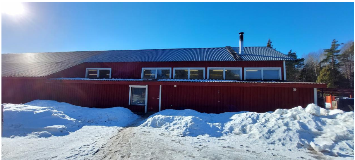
Foto 11. Lootuse Küla saekaater

Meile räägiti, et igal rehabilitatsiooniprogrammis osaleval inimesel on kohustus teha päevas 6 tundi tööd vastavalt oma võimetele, tervislikule olukorrale ja oskustele. See on tööpraktika, mida võimaldatakse igale programmis osalejale ning mille eesmärgiks on tööks vajalike teadmiste ja oskuste omandamine ning täiendamine. Samas on see ka tööharjutus, mis soodustab tööharjumuse taastumist või esmase tööharjumuse omandamist. Elementaarne on töö igapäeva vajadusi katvate tegevuste vallas – elukeskkonna eest hoolitsemine, toitlustus, koristamine ja küla arendamine. Peamiseks tööpraktikabaasiks on aga tööstus ehk saekaater (foto 11) ning ka ehitus- ja metsatööd.