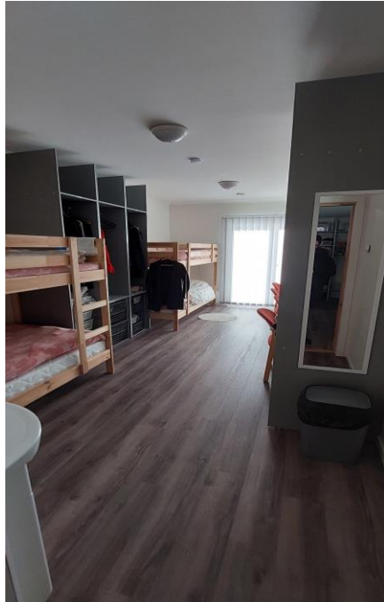
Foto 20. Eluruum