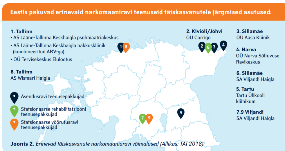
Foto 2. Narkomaaniaravi teenuseid täiskasvanutele pakuvad asutused 12

Tervise Arengu Instituudi andmetel pakuvad Eestis erinevaid narkomaania teenuseid täiskasvanutele järgmised asutused: