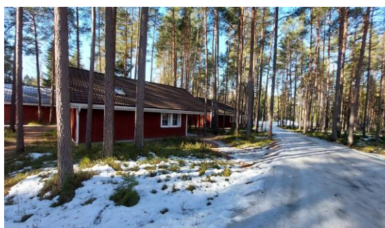
Foto 18. Elumaja

Lootuse Külas elatakse väikestes majades (fotod 18, 19), milles on kõik eluks vajalik – voodi, kapp, isiklikud asjad (foto 20, 22). Suhete arenemise vältimiseks on mehed ja naised eraldi majades ning neil on oma kindel tsoon, kus nad vabal ajal liikuda tohivad. Naiste majas on eraldi puhkeruum (foto 21) ning magamistube ühendab pesemisruum. Väljas on ka jõusaalitreeningu võimalused.