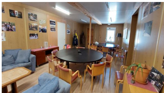
Foto 23. Vastuvõturuum

Lootuse Külas on olemas vastuvõtupunkt (foto 23), kus saab sinna äsja tulnud inimesega vestelda. Samas hoones on olemas ka väike pood ja kohvik.