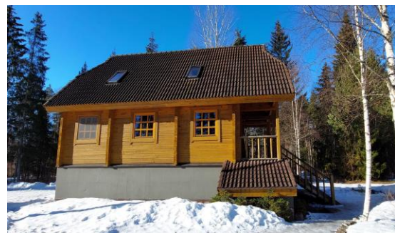
Foto 24. Selles majas toimub enamik tegevustest. Söökla asub hoone keldrikorrusel

Tulevikus on plaanis rajada ka vabaaja veetmise keskus.