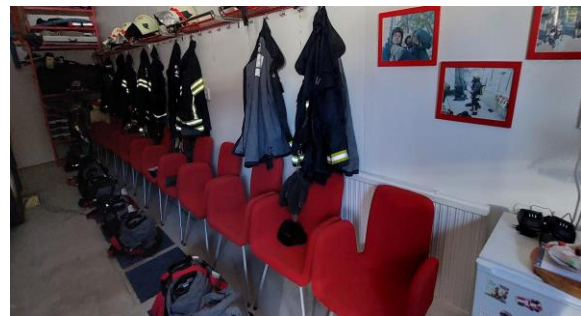
Foto 17. Tuletõrjajate ootel valmis

Lootuse Küla tunnustati 2019. aastal parimaks siseturvalisusesse panustavaks organisatsiooniks Harjumaal (lisa 1).