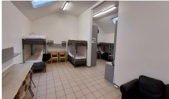
Foto 22. Eluruum

Lootuse Külas on olemas vastuvõtupunkt (foto 23), kus saab sinna äsja tulnud inimesega vestelda. Samas hoones on olemas ka väike pood ja kohvik.