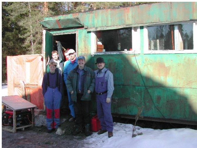
Foto 6. Lootuse Küla elanikud soojaku ees