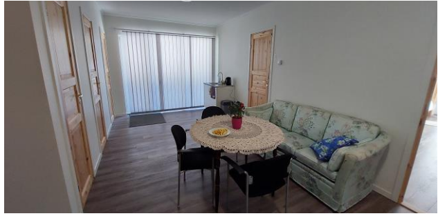
Foto 21. Puhkeruum naistemajas