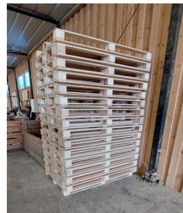
Foto 14. Kaubaalused

Talviti töötatakse ka metsas, tehakse küttepuid Lootuse Küla hoonete kütmiseks. Palju tehakse erinevaid haldus- ja korrastustöid – talvel lume-, sügisel lehtede koristamine, suvel niitmine jne.