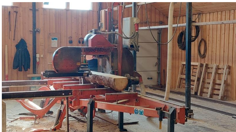
Foto 13. Saekaatris töötav lintsaag