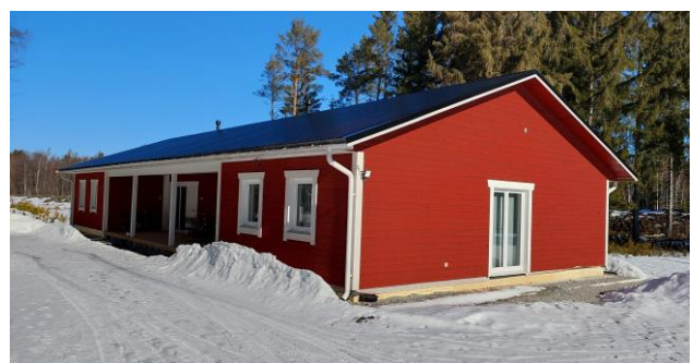
Foto 19. Elumaja