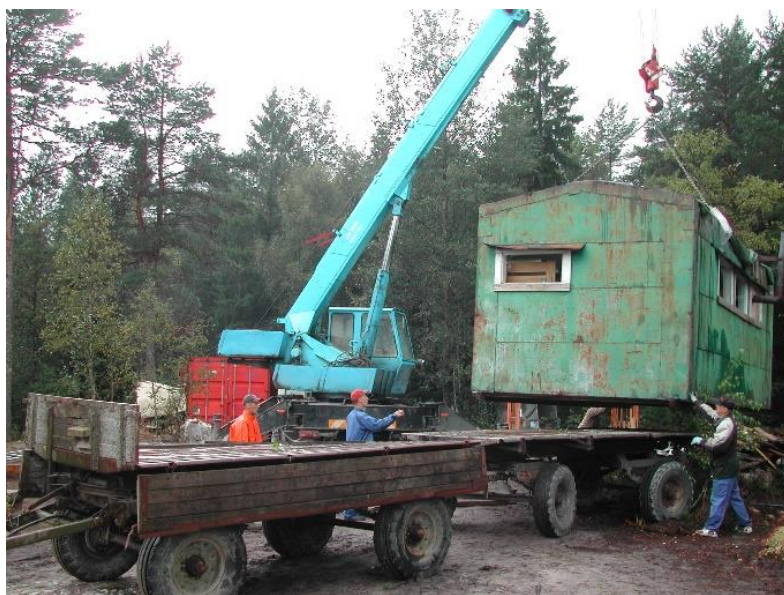
Foto 5. Soojaku paigaldamine