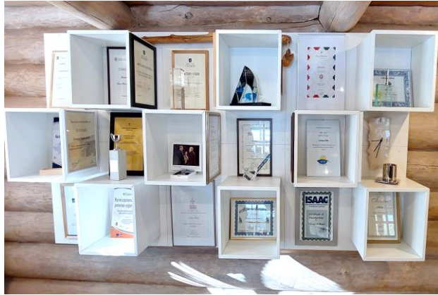
Foto 9. Kontorihoones asub riiul, kuhu on väljapandud Lootuse Külale omistatud tänu- ja aukirjad ning muud olulised esemed.