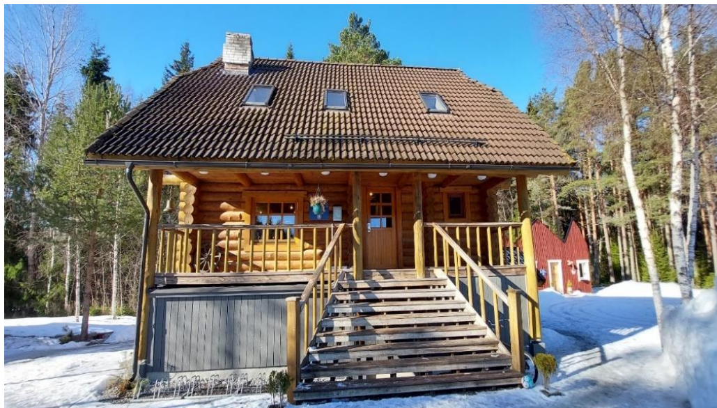
Foto 8. Lootuse Küla kontori- ehk administratiivhoone

Lootuse Küla töötajate arvates on kõige rõõmustavam nende töö juures see, et 69% programmi lõpetanutest elavad head ja korralikku elu, neil on töö ning nende suhted lähedastega on taastumas. 17