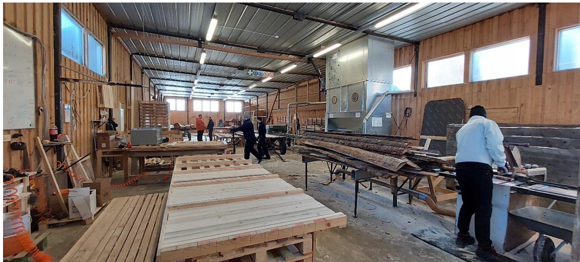
Foto 12. Töö saekaatris

Lootuse Küla saekaatris (foto 12) töötatakse lintsael (foto 13), järkamissael, seimeril ja veel teistelgi masinatel. Samuti pannakse kokku kaubaaluseid (foto 14), juurviljakaste ja muid tellimustooteid. Kõik hooned külas on ehitatud ühistööna personali, programmis osalejate ja vabatahtlike abiliste poolt. Üks tööharusid on ka küttepuid tootmine.