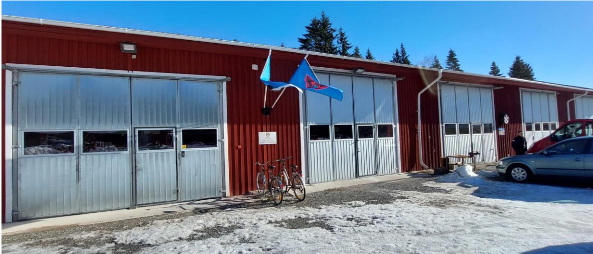
Foto 15. Lootuse Küla päästekomando, toiduladu ja töökoda