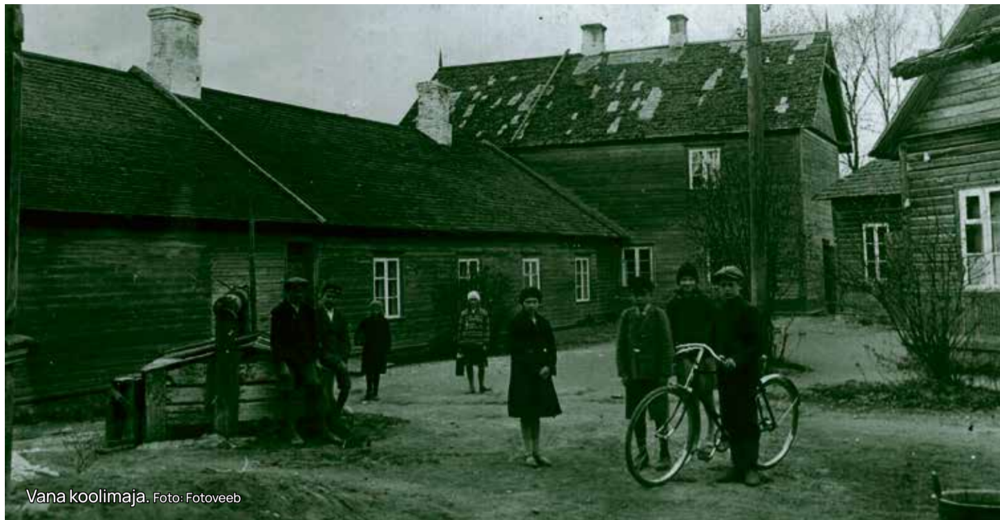
Vana koolimaja.