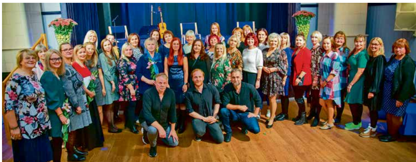
Haridustöötajad koos.