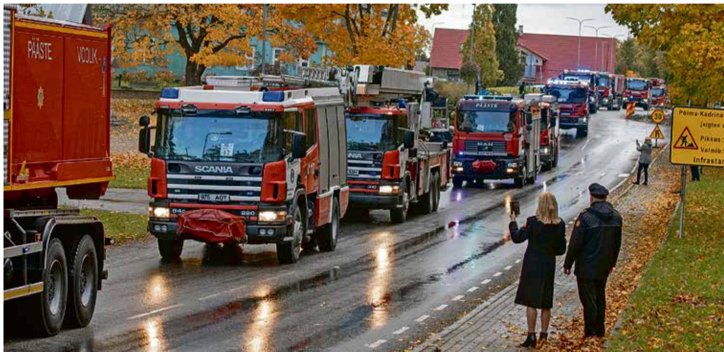
Päästeautode paraad Kadrina tänavatel.

Kadrina vabatahtlikud on uhked, ja põhjusega. Kõik Ida regiooni eliitkomando võidukarjad on nende riulil. Neil on tänaseni alles ja korda tehtud oma ajalooline komandohoo-