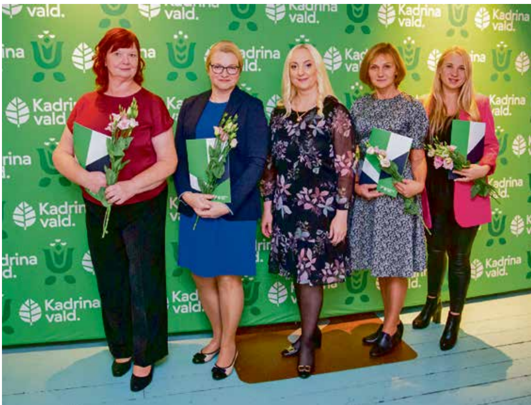
Kadrina Keskkooli haridustöötajad.