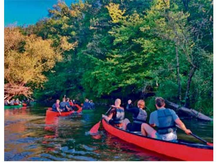
Kanuumatkal Fulda jõel koos Saksa õpilastega.

Sügava mulje jättis UNESCO maailmapärandi hulka kuuluv Kassel Bergpark Wilhelmshöhe, kus asub 300 aasta vanune kuuluis Heraklese skulptuur