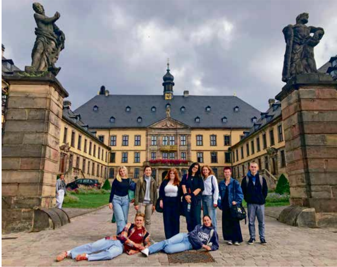
Eesti ja Saksa õpilased Fulda lossi ees.

Eeltööd jagus päevadeks, kuid õpiränne kestis 16.–22. septembrini. Eeltöö hulka kuulus esitluste valmistamine, mis