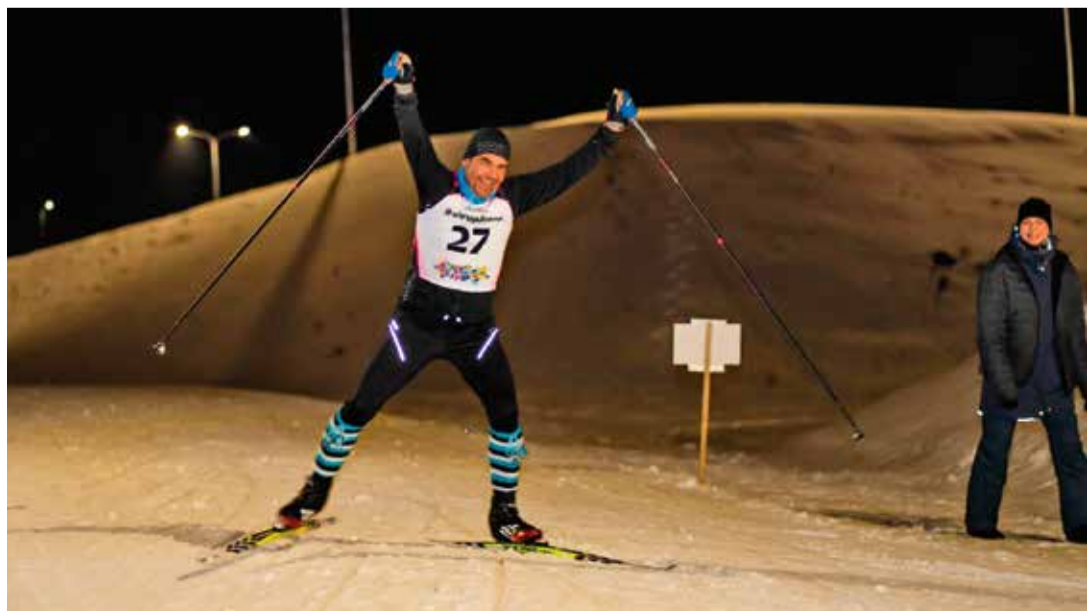
Kui finišijoon paistab...