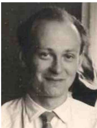
...ja täiskasvanuna.

Eesti vabariigi 35. aastapäeval, 24. veebruaril 1953 plaaniti