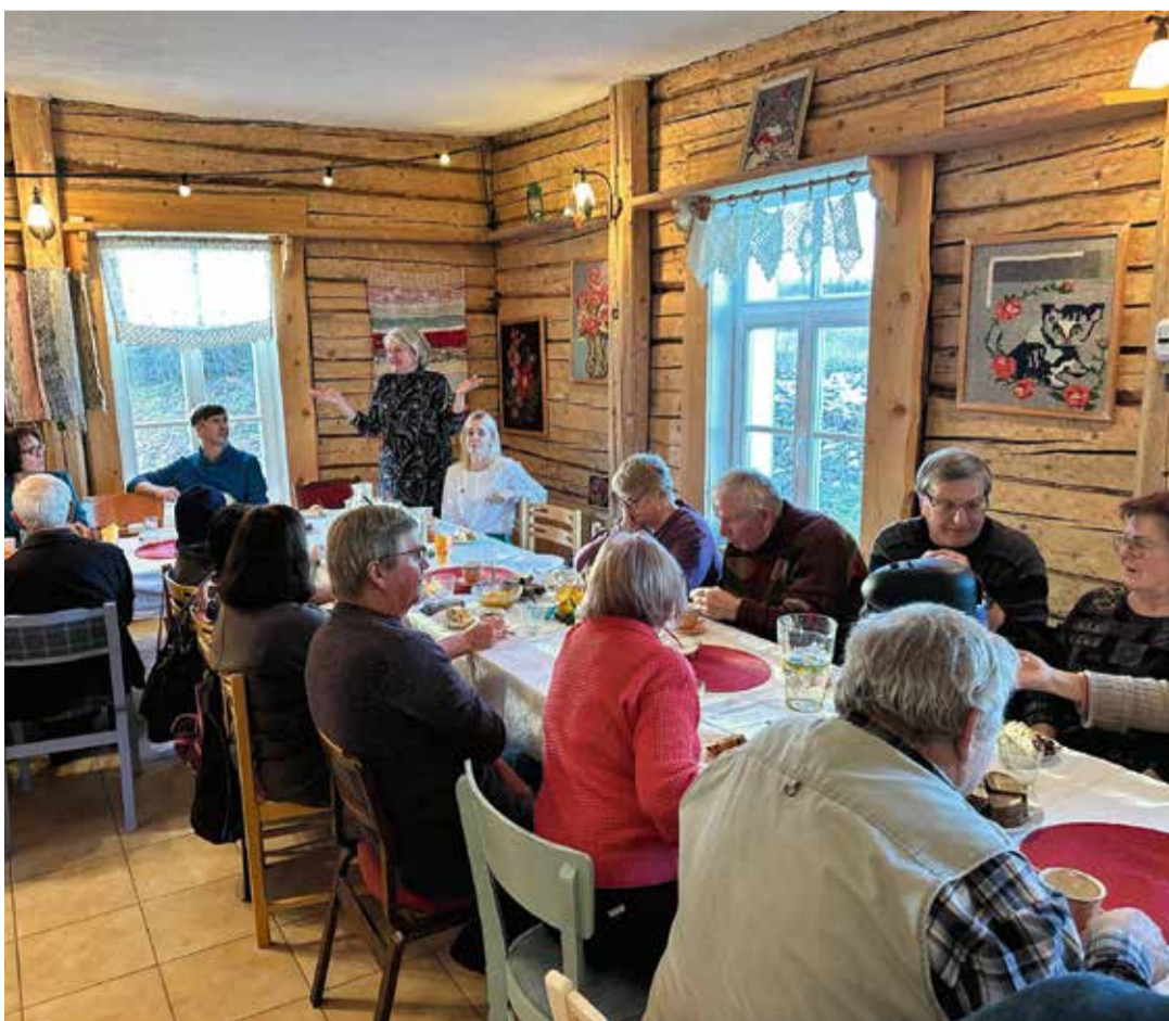
Eakate ümarlaud Ridaküla seltsimajas – vallavanem eakatega mõtteid vahetamas.