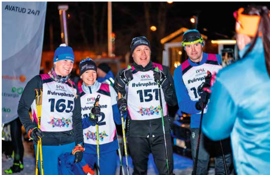
Nakkav rõõmsameelsus.