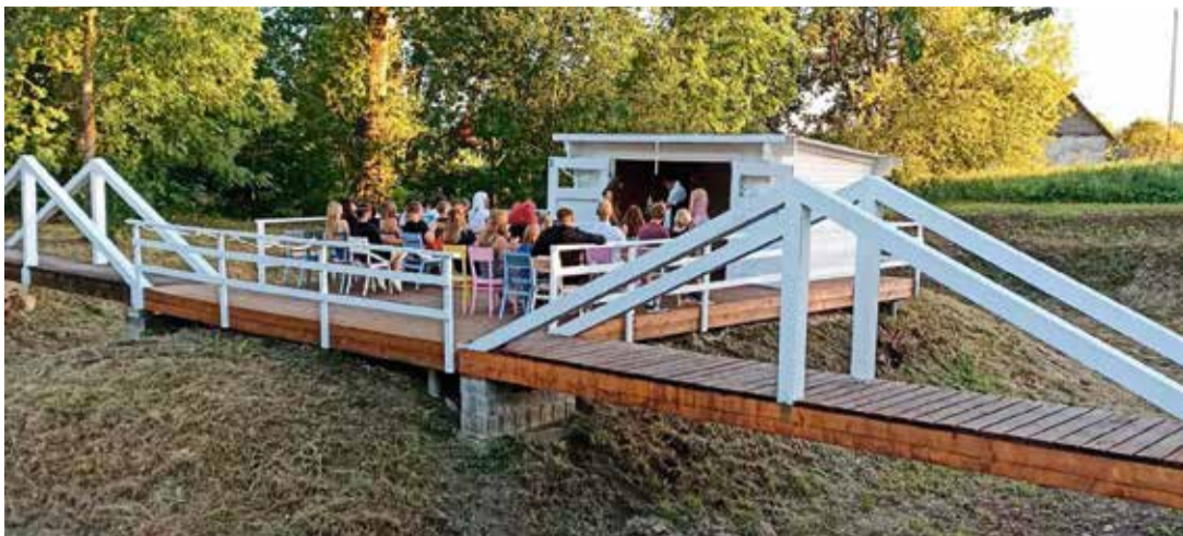
Ridaküla tiigi saarelava.