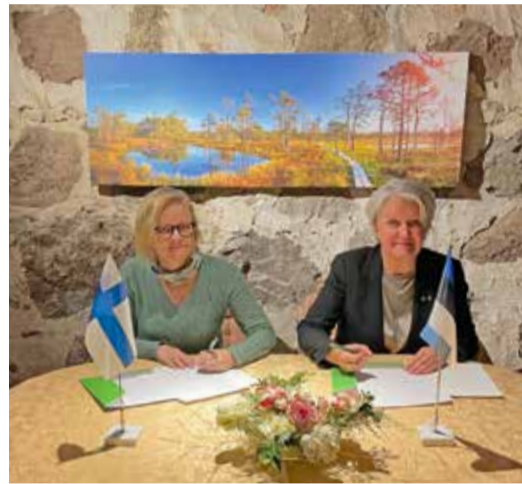
Kadrina ja Janakkala vallajuhid koostöölepingut allkirjastamas.

Soome delegatsioon külastas Hakaplast OÜ-d, Kadrina Vabahtlikku Päästet, suusamaja,