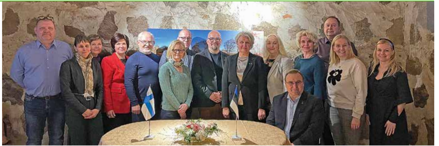
Kadrina ja Janakkala valla kohtumise ühispiilt.