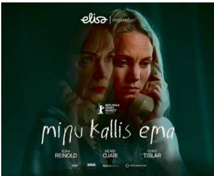
Seriaali „Minu kallis ema“ plakat. Repro: Elisa Eesti