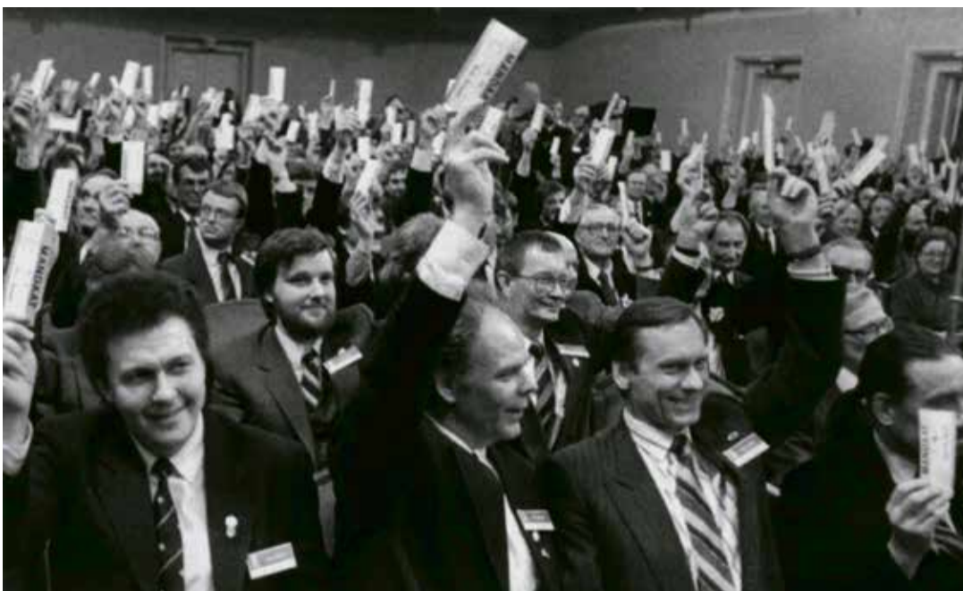
Esimese Eesti Kongressi istungjärgust osavõtjad hääletamas.

Kadrina kirikuaias taastati samal ajal Gustav Johannes Beermanni rajatud Vabadussõja mälestussammas, mis 1941. aastal osaliselt hävis. Õnneks oli mälestuskalju nii tugev, et kommunistidel polnud isegi lõhkeainest kasu. Kadrina Muinsuskaitse Seltsi esimees