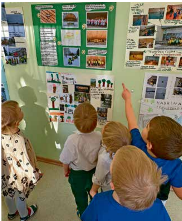
Mudilased lasteaia näitust tutvustamas.