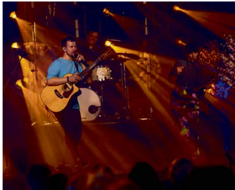
Trad.Attack! aktusel esinemas.