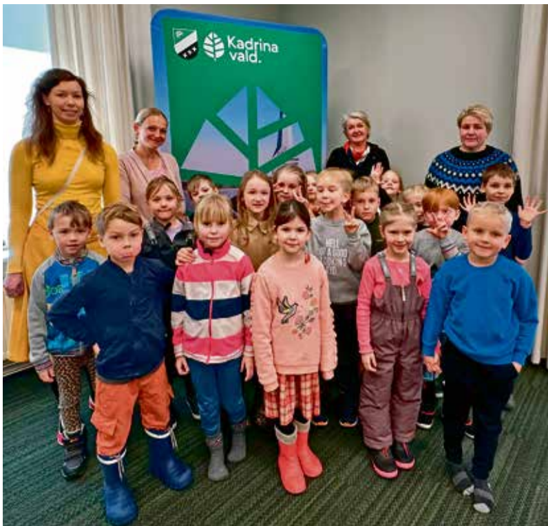
Lepatriinude rühm Kadrina vallavalitsuses.