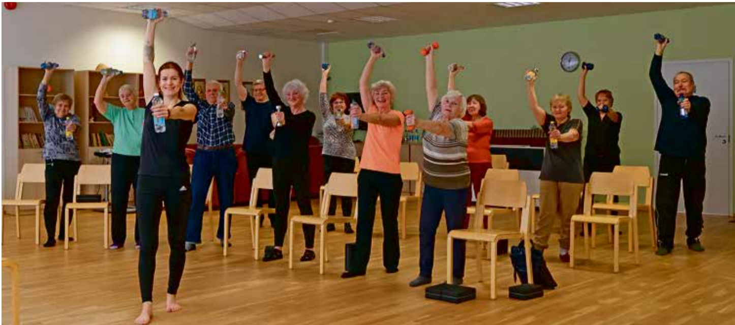
Rõõmsate võimlejate II rühm.

Esimesel kohtumisel ei osanud esiti osalejate arvu prognoosida. Seda suurem oli aga rõõm, kui saal sai huvilisi täis. Sealt hakkaski pall veerema. Kes kutsus kaasa sõbranna, kes