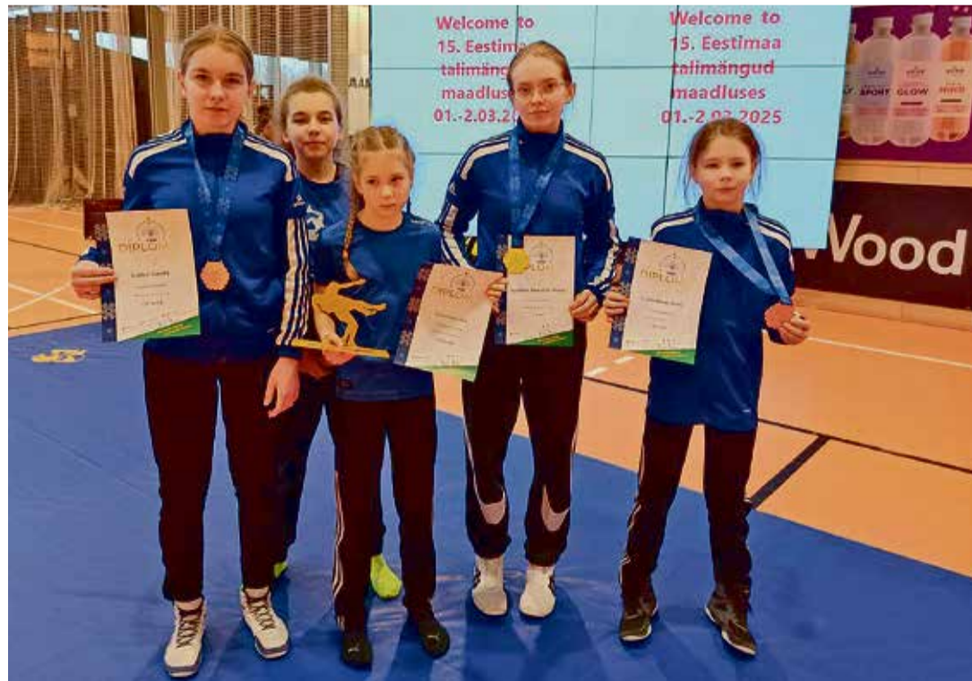
15. Eestimaa talimängude maadluse võitlused. Kadrina valla noored maadlejad.