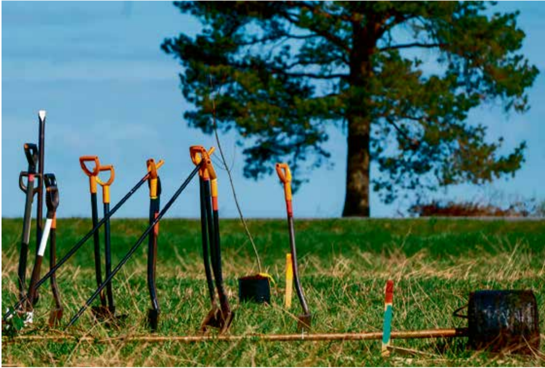
Tammepargi rajamise I etapp 2024. aastal.

se kasvuga graatsiline kase vorm, mille lehed on tugevalt lõhestunud. Mai keskel ilmuvad puule kollased urvad. • Harilik vahter 'Princeton Gold' ( Acer platanoides ) on kollaselehine vahtra sort munajasoovalse võraga. Varjus kasvades kaob kollane lehevärv suve keskpaigaks. • Serbia kuusk ( Picea omorika ) on kitsavõraline sort. Okkad on kahevärvilised – pealt tumerohelised, alt valged. Puu hakkab noorelt käbisid kandma.