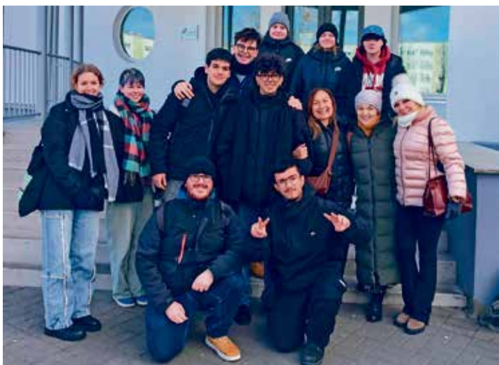
Külalised Sitsiiliast koos Eesti sõpradega enne ärasõitu.