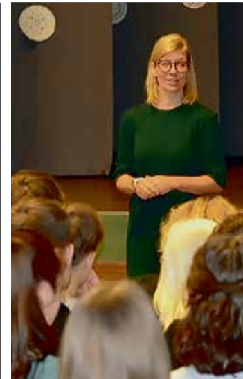
Regionaal- ja põllumajandusminister Piret Hartman noortega vestlemas.